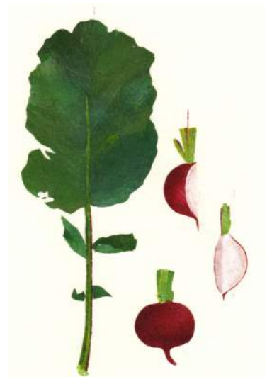
《ハツカダイコン》田辺、2019年

2019.5.21 (火) — 5.26 (日) 11:00 — 19:00 入場無料 | ご自由にお入りください