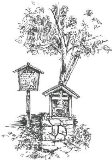
《椿とお地藏さん》大原、2012年