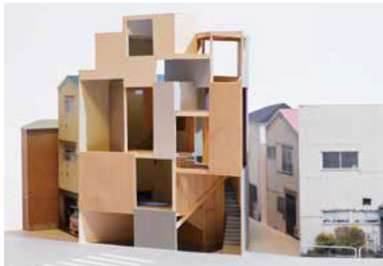
2 Sides House