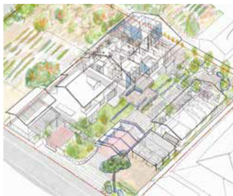
場と人をつなぎ直す 建築と庭の遷移 農家住宅の不時着