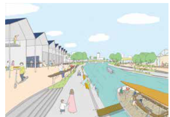
中川運河再生計画案「みんなの運河」