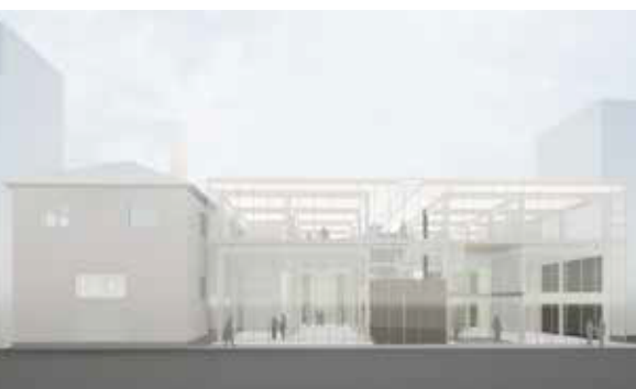
被爆建物を有する社屋の持続的更新計画