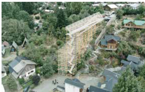
斜面住宅地をつなぐ柔らかなインフラ