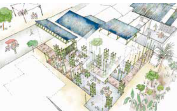
チャマンガの工房